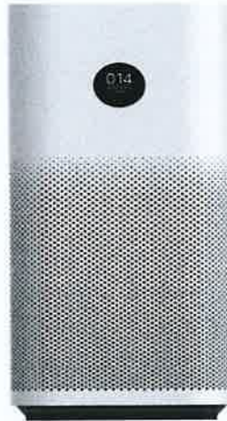
Immagine a colori del prodotto: